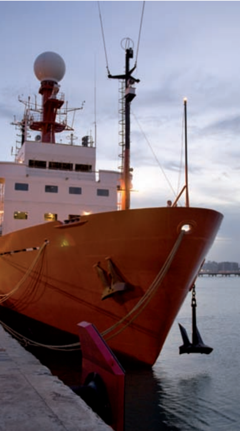
La campanya MOC2-Equatorial es va realitzar a bord del vaixell de recerca oceanogràfica Hespérides des de Fortaleza (Brasil) fins a Mindelo (Cap Verd). En total van ser 42 dies de navegació durant l'abril i el maig del 2010 a l'oceà Atlàntic tropical i equatorial en el qual van participar investigadors de diverses institucions nacionals i internacionals.

del Nord de Brasil transporten grans quantitats de calor cap a les regions més septentrionals de l'Atlàntic i permeten, entre altres coses, que l'Europa del nord tingui un clima suau. Part d'aquest flux de calor ve de l'oceà Índic, que és un oceà tancat pel nord, per la qual cosa tota la calor radiativa emmagatzemada a la regió tropical ha d'anar cap al sud i pot parcialment escapar vers l'Atlàntic mitjançant el corrent d'Agulles, però una gran part ve precisament de l'escalfament de les aigües antàrtiques durant el seu trànsit per l'Atlàntic sud i equatorial.