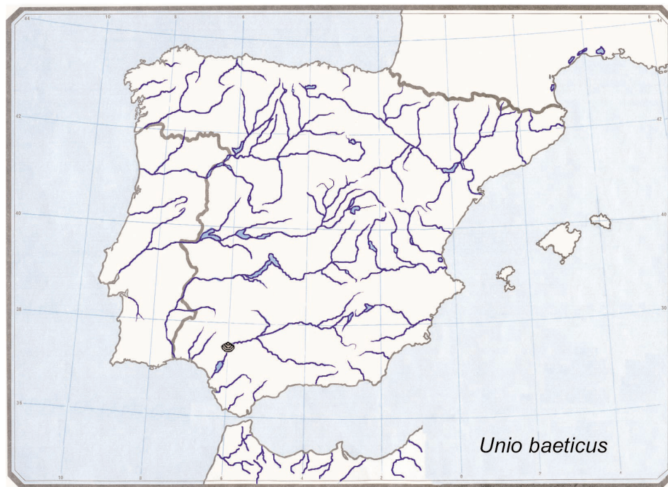
Fig. 4.— Distribución del material contenido en las Colecciones del MNCN de Unio baeticus Kobelt, 1887.