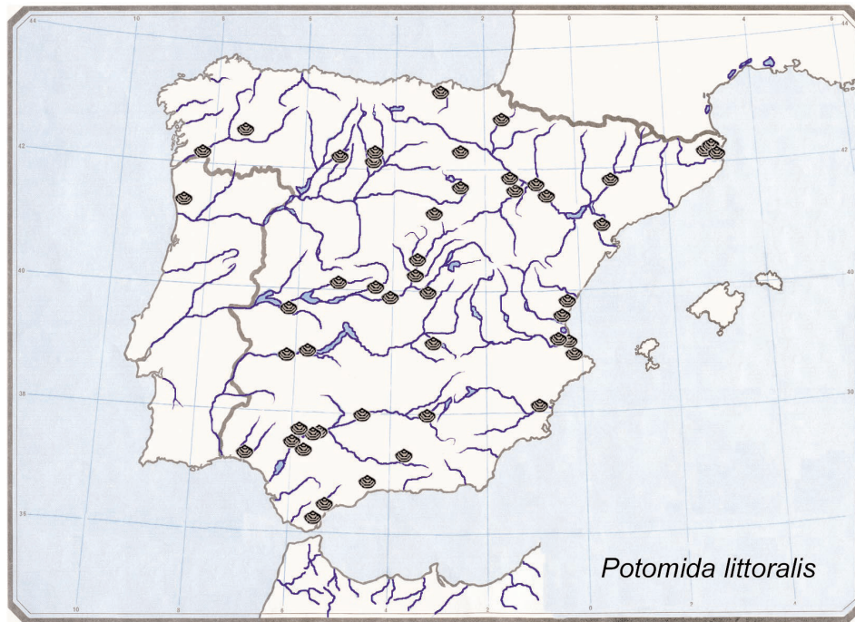
Fig. 5.— Distribución del material contenido en las Colecciones del MNCN de Potomida littoralis (Lamarck, 1801).