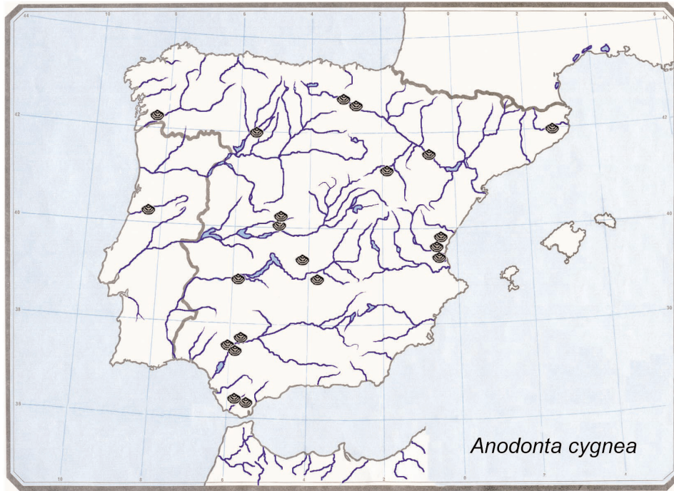
Fig. 6.— Distribución del material contenido en las Colecciones del MNCN de Anodonta cygnea (Linnaeus, 1758).