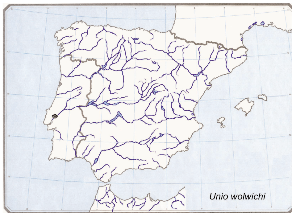
Fig. 3.— Distribución del material contenido en las Colecciones del MNCN de Unio wolwichi Morelet, 1845.