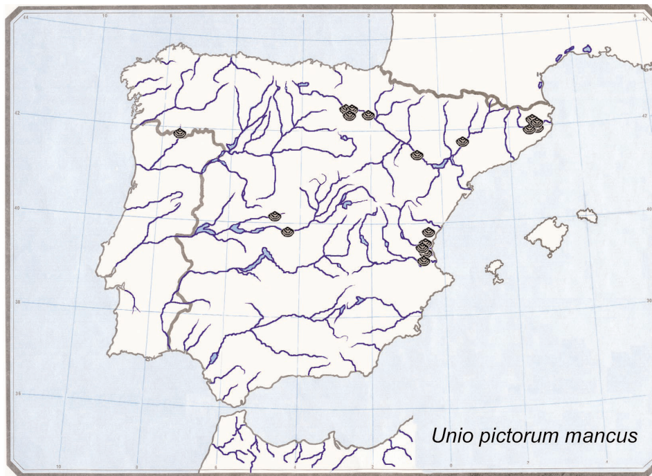
Fig. 2.— Distribución del material contenido en las Colecciones del MNCN de Unio pictorum mancus Lamarck, 1819.