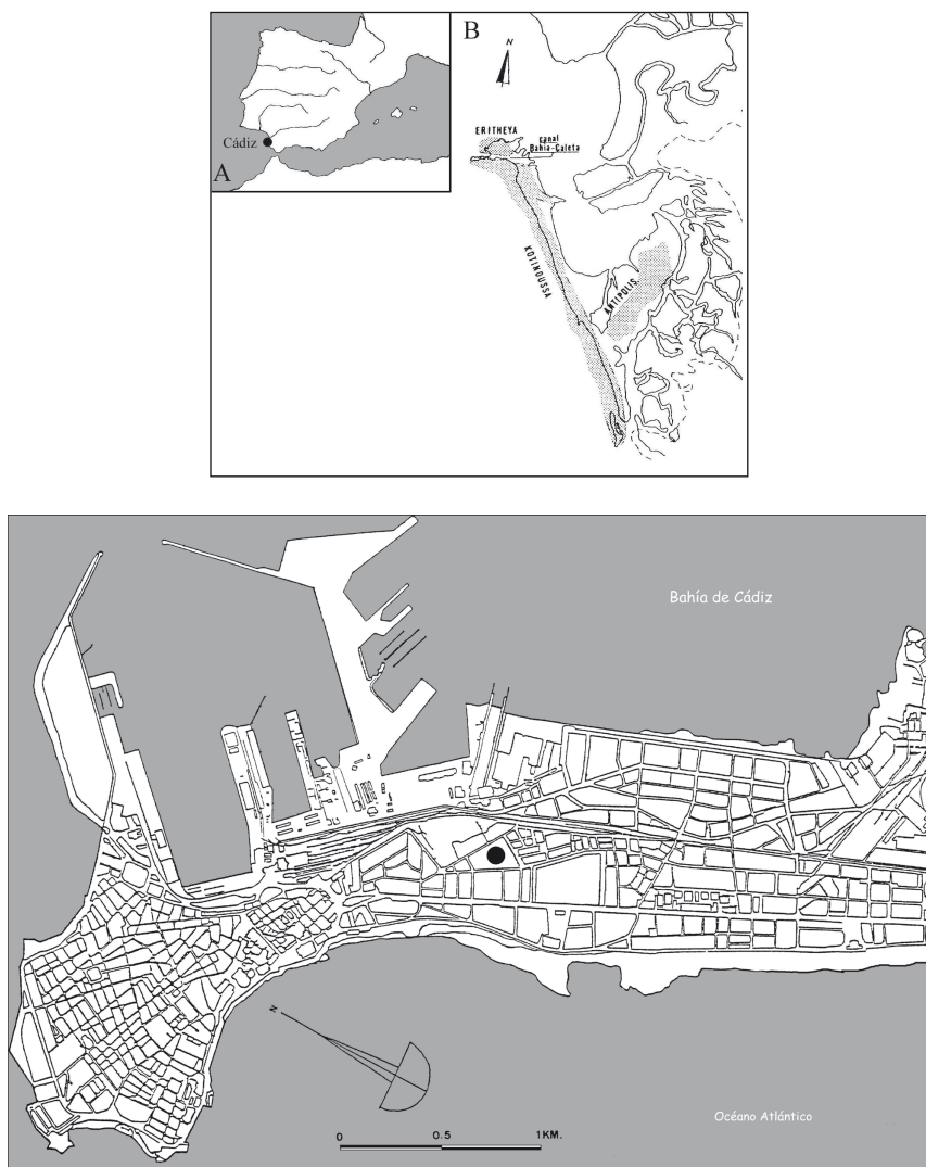
Fig. 1: Situación del yacimiento («Ciudad de la Justicia», Cádiz, España)

polis púnica de Cádiz; hecho que, junto a otros indicios como la aparición entre los materiales de un “pebetero en forma de cabeza femenina”, nos ha llevado a plantear que se trate de enterramientos de individuos cartagineses o norteafricanos 8 .