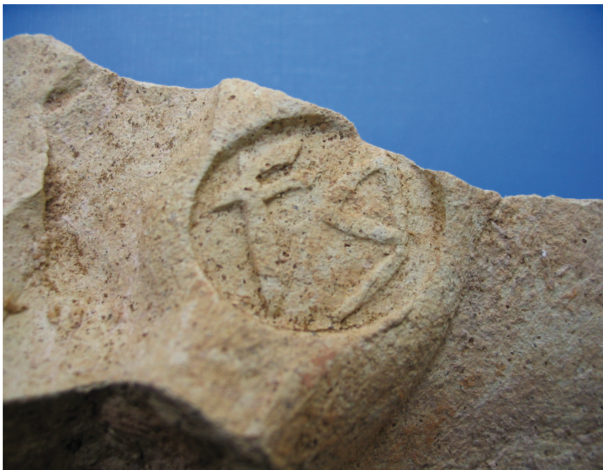
Fig. 4: Detalle del sello.

su deposición y hallazgo: tan sólo la parte superior de la cartela queda levemente interrumpida por la línea de rotura del fragmento conservado.