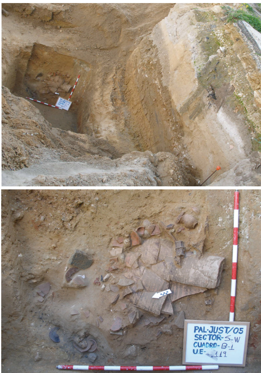
Fig. 2: Arriba: vista general de la fosa púnica. Abajo: Detalle de la misma. Perfil estratigráfico en la cara SE manteniendo las cerámicas y restos óseos hallados. Entre el material cerámico se advierten grandes fragmentos de ánforas, un posible bolsal tipo “Kuass”, platos de pescado y cuencos planos. Se halla también una piedra volcánica plana junto a un fragmento de hierro curvado o afalcatado.