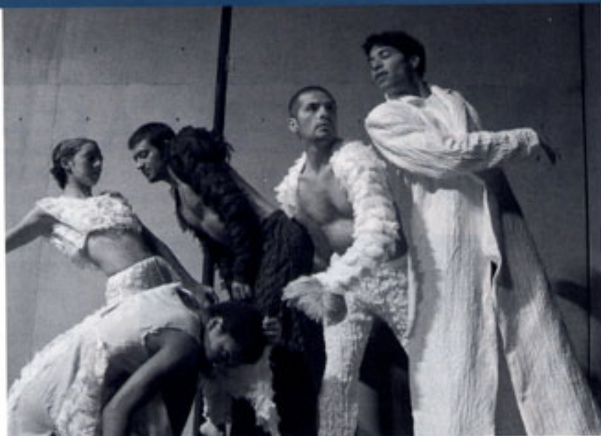
La mirada del sordo (Paul Auster).

En lo que se refiere al primer ámbito, señala el dramaturgo que "se suele olvidar que la tercera raíz de la teatralidad, junto al rito y la fiesta, es el relato oral" y propone la distinción de tres niveles que van de la epicidad "pura" a la dramaticidad "plena" . 1) "Epicidad pura" del texto narrado directamente al público por un único actor (en realidad, narrador); 2) "Narradores múltiples" que