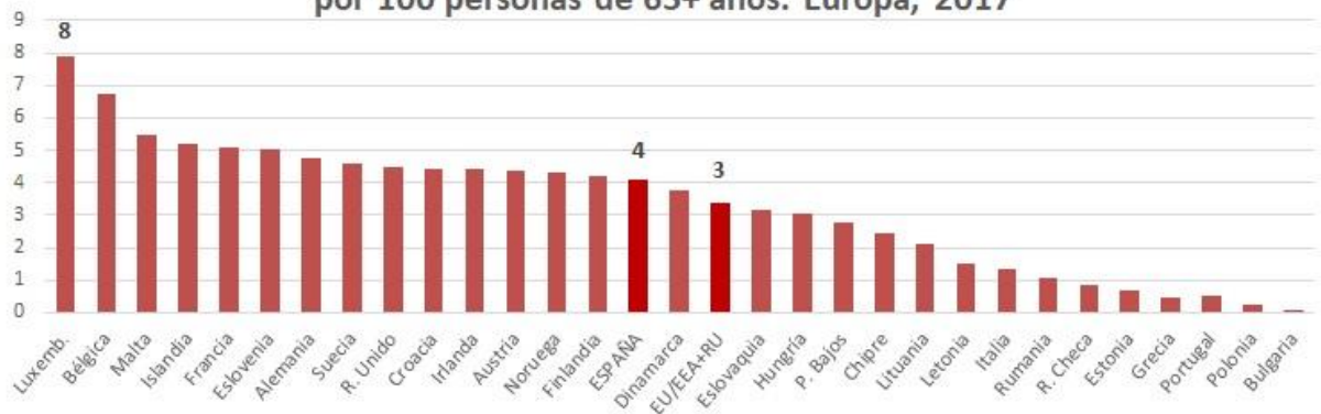
Figura 2.- Establecimientos de cuidados de larga duración. Camas por 100 personas de 65+ años. Europa, 2017