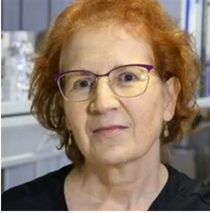
Margarita del Val.

La idea de espaciar las dosis de vacunación no es descabellada, pero yo no estoy a favor de aplicarla hasta no conocer el impacto que tiene. Estamos cerca de poderlo conocer cuando hagan públicos los resultados detallados por edades y bien analizados, de la experiencia de estos 3 meses con toda la población vacunada de Reino Unido.