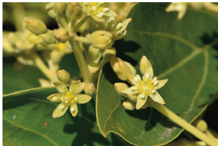
Figura 1. Flores de aguacate, diferencias entre la flor en estado femenino (izqda.) y masculino (dcha.). La flor en estado femenino se está cerrando mientras que la flor en estado masculino se está abriendo. Dependiendo de las condiciones ambientales este solape en estados sexuales dentro de la misma panícula y árbol puede durar entre 2 y 4 horas favoreciendo la transferencia de polen por insectos desde flores en estado masculino a flores en estado femenino.

A nivel mundial, la abeja de la miel, introducida en América por los españoles en el siglo XVI (Crane 1992; Roubik 1998), es un importante polinizador para el aguacate, aunque debido al poco atractivo de sus flores, la polinización suele ser poco eficiente y estas abejas frecuentemente se desplazan a flores de otras especies que les son más atractivas. Cuando se compara la composición de néctar de las flores de aguacate con la de cítricos (que resulta altamente atractivo para las abejas), se observa un mayor contenido en potasio y fósforo, elementos que resultan repelentes para las