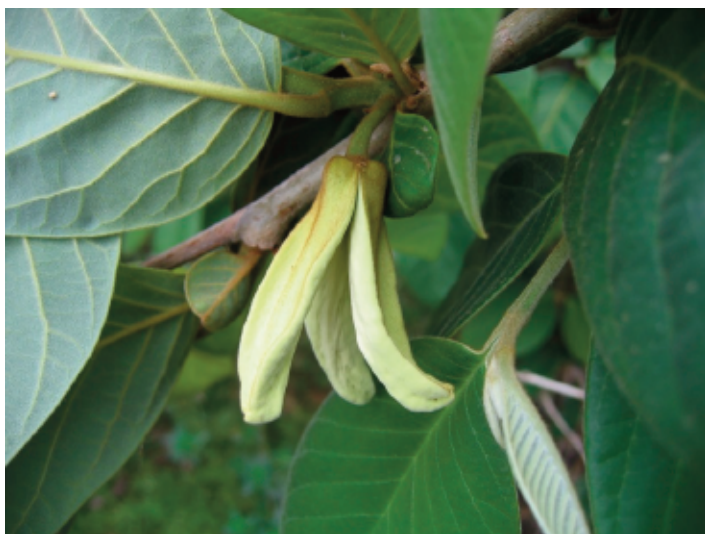
Figura 3. Flores de chirimoyo.