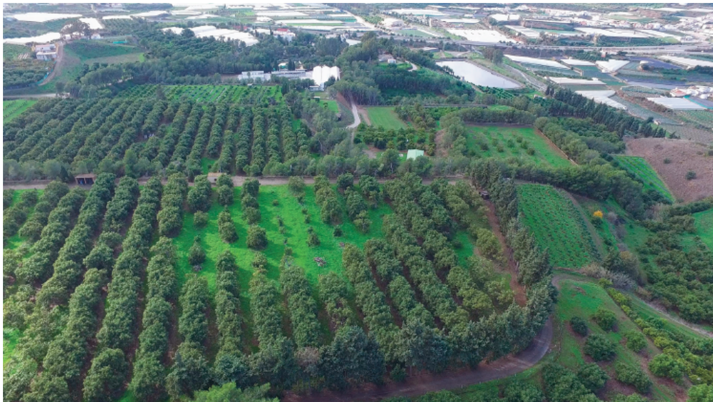
Figura 5. Foto aérea de la estación experimental La Mayora del Instituto de Hortofruticultura Subtropical y Mediterránea la Mayora (CSIC) en Algarrobo-Costa, Málaga, donde se aprecian distintas parcelas con colecciones de mango, aguacate y chirimoyo.

Figure 5. Aerial photo of La Mayora experimental station that belongs to the Spanish National Research Council (CSIC) in Algarrobo-Costa, Malaga, Spain; different experimental plots and parcels holding germoplasm collections and cultivars of mango, avocado and cherimoya.