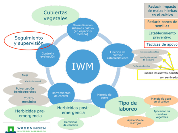
Figura 3. Marco de trabajo diseñado dentro del WP 1 para establecer las estrategias de manejo IWM a evaluar en el cultivo del olivar en España (WP 6).

En resumen, los experimentos del proyecto IWMPRAISE contemplan un doble propósito. Por un lado, proporcionar resultados que permitan evaluar los posibles efectos a corto plazo de las estrategias de manejo integrado estudiadas y, por otro lado, servir para fines demostrativos y difusión de resultados. Por ello, este congreso es una magnífica oportunidad para dar visibilidad al proyecto y difundir su existencia. A lo largo de cada año se organizarán jornadas de campo y otras actividades de divulgación, y se elaborará una lista de buenas prácticas en un intento de mejorar los sistemas de manejo de suelo en olivar, su sostenibilidad y rentabilidad.