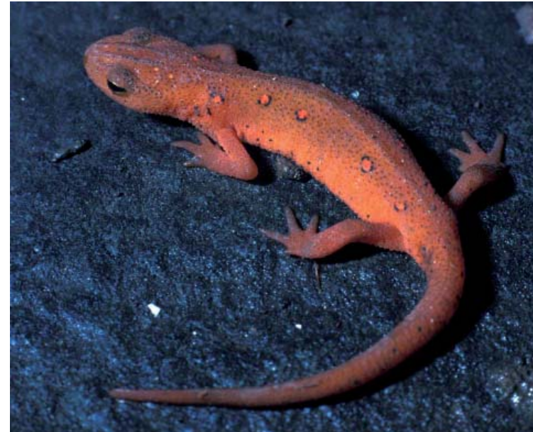
Eurycea bislineata , habitante de zonas de bosques templados, así como cursos de agua dulce, e incluso zonas urbanas. Como otros pletodóntidos, carecen de pulmones, por lo que la respiración se realiza a través de la piel. Su fecundación es interna y en muchos casos las madres de Eurycea quedan al cuidado de las puestas hasta la eclosión de las larvas.

mundo y son los únicos que han colonizado el trópico. Las únicas excepciones son ocho especies del género Hydromantes que viven en Europa y una especie asiática ( Karsenia koreana ). La familia Salamandridae, euroasiática salvo dos géneros norteamericanos, presenta dos grupos bien diferenciados: los tritones (87 especies) y las que a veces se conocen como “verdaderas salamandras” (18 especies), 12-14 de las cuales son vivíparas. La familia Hynobiidae (60 especies) se encontraría exclusivamente en Asia. Y hay otras familias norteamericanas, como las ‘sirenas’ ( Sirenidae ) y Amphiumidae que tan solo incluyen tres o cuatro especies de salamandras cada una, con una morfología muy derivada y adaptadas a la vida en zonas pantanosas. Las salamandras han sido históricamente, y continúan siendo, un grupo excepcional para estudiar el cómo, cuándo, dónde y el porqué de