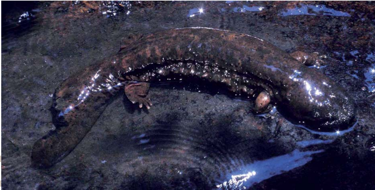
Una de las salamandras de mayor tamaño conocido, Cryptobranchus alleganiensis , salamandra gigante americana relacionada con las japonesas y chinas del género Andrias . Estos ejemplares llegan a medir más de 70 cm.

do normalmente en el agua, protegidos entre la vegetación o aglutinados en masas gelatinosas. Una vez completado el desarrollo embrionario, de cada huevo eclosiona una pequeña larva o renacuajo acuático, con branquias para la respiración, que pasa un tiempo en el agua alimentándose y preparándose para la metamorfosis. La metamorfosis implica un cambio drástico en la forma del renacuajo y en su fisiología, permitiéndole abandonar el medio acuático e iniciar como juvenil la fase terrestre del ciclo. Este ciclo anfibio, sin embargo, se ha modificado repetidas veces en las salamandras, desembocando en espectaculares adaptaciones.