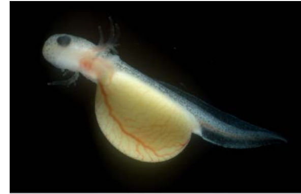
Pequeño embrión de salamandra con 19 días, que eclosiona con branquias para permitir la respiración durante su periodo de vida acuática.

Para empezar, en el 90% de las especies de salamandras la fecundación de los huevos ocurre dentro de las hembras (fecundación interna). Los machos de estas especies organizan sus espermatozoides en pequeñas bolsas (espermátóforos) que depositan en el suelo para que las hembras los absorban con los labios de la cloaca durante la cópula. El esperma queda almacenado en unas 'espermatecas', en algunos casos durante meses o incluso más de un año. Cuando los huevos están maduros y listos, se produce la ovulación y fecundación de los huevos dentro de los oviductos maternos. La fecundación interna conlleva, por tanto, el separar el momen-