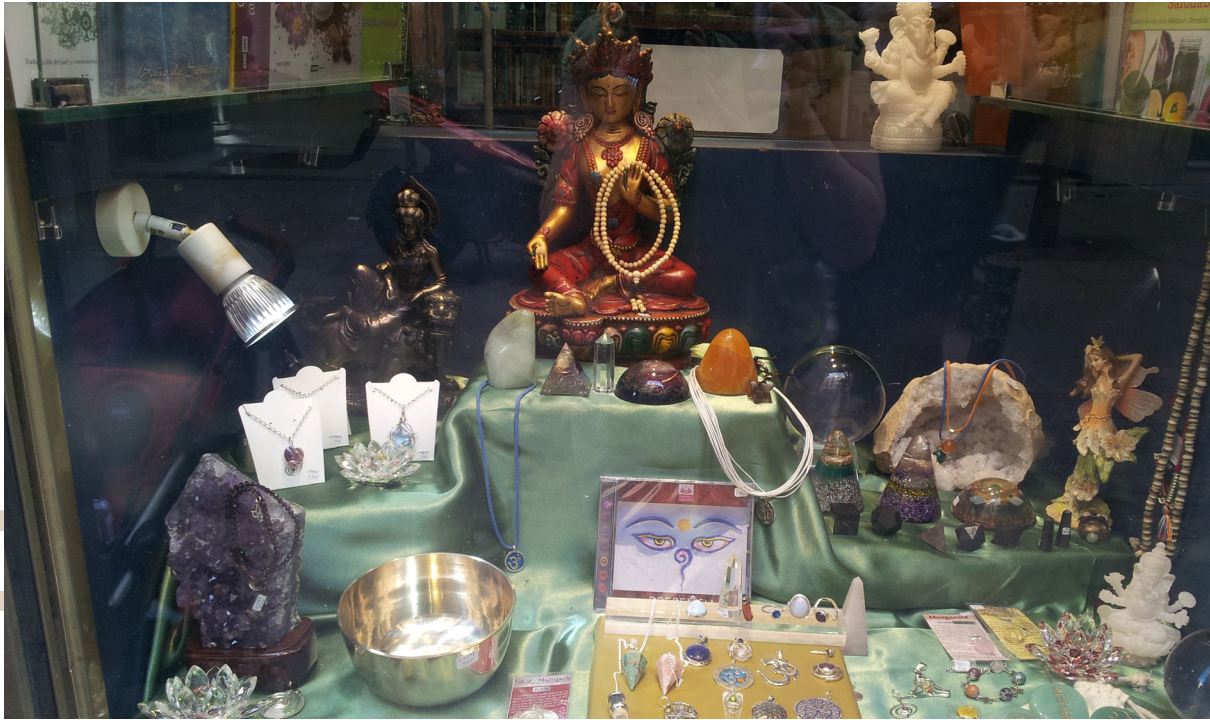
Todo tipo de amuletos para mejorar las vibraciones / Xiomara

Podríamos además añadir un elemento protector ante el previsible fracaso. Es el último recurso del que engaña (o el que se autoengaña): cuando algo no responde a la pseudo-terapia siempre cabe aquello de ‘esto cura CASI en el 100% de los casos, y va a resultar que usted está en ese ínfimo 1% que se resiste.’ Como generalmente no se tienen estadísticas fiables de curaciones, ese 1% puede ser ‘cualquier cantidad’, que se dice por Sudamérica.