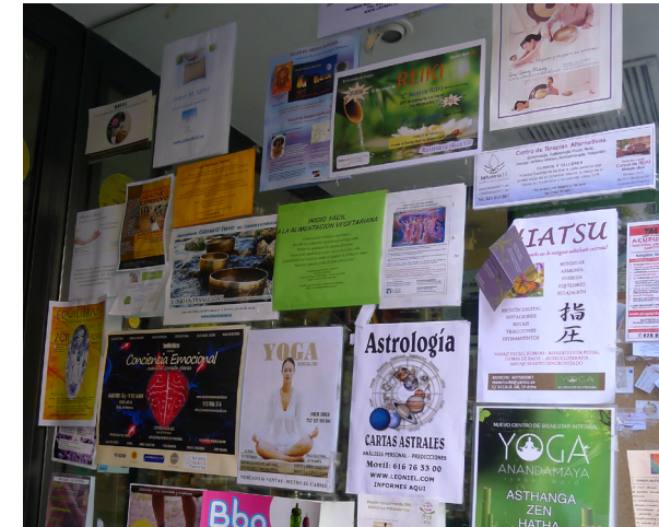
Tablón de anuncios de remedios para todo de una tienda de ‘productos alternativos’

“Un título de doctor concede credibilidad a quien lo tiene pero, aparte de las personas, está el conocimiento, que debe ser contrastado”