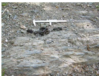
Figura 1. Excrementos de marta europea con función de marcaje, depositados sobre una piedra (sustrato llamativo y elevado) y formando letrina.

La marta utiliza como marcas oloroso-visuales además de secreciones de las glándulas anales y ventrales, orina y heces (Pulliainen, 1982; Brinck et al., 1983; Hutchings y White, 2000; Barja, 2005a). Las heces con una función en la comunicación química son depositadas sobre sustratos llamativos y/o elevados (principalmente piedras y matas de hierba) y generalmente forman letrinas constituidas de 6 a 10 deposiciones, aumentando así la eficacia de las señales fecales (Pulliainen, 1982; Barja, 2005a). La altura media a la cual son depositadas las heces es de 5,8 cm (rango= 2,5-9,5 cm; n= 156) (Barja, 2005a). La especie selecciona los laterales y centro de los caminos para depositar las marcas fecales y en zonas de laderas el 64,6% de los excrementos son emplazados principalmente en la región exterior del camino, la más expuesta (Barja, 2005a). La marta deposita una alta proporción de marcas fecales cerca de los bordes territoriales y en zonas centrales de los mismos (Pulliainen, 1982).