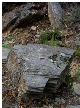
Figura 2. Excrementos de marta europea con función de marcaje, formando letrina.