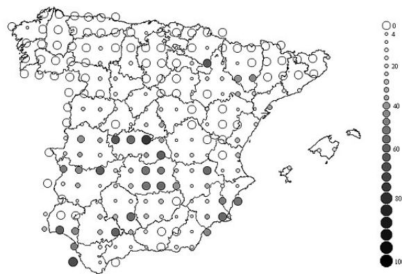
Figura 1. Los círculos representan el porcentaje de cuadrículas UTM 10x10 km ocupadas por la especie en bloques UTM de 50x50 km, Sociedad Española de Ornitología .

Especie de reparto irregular a lo largo del sector español de la Península Ibérica. La mayor frecuencia de aparición en cuadrículas UTM de 10x10 km dentro de bloques de 50x50 km se produce en algunas áreas del centro y sur de la península y en la cuenca del Ebro (Figura 1)