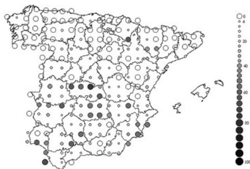
Figura 1. Los círculos representan el porcentaje de cuadrículas UTM 10x10 km ocupadas por la especie en bloques UTM de 50x50 km. Análisis efectuado a partir de los datos del Atlas de las Aves de España (2003).

El 59% de la variabilidad geográfica en su frecuencia de ocupación de cuadrículas UTM de 10x10 km puede explicarse por el árbol de regresión (modelo generalizado aditivo) de la Figura 2. La mediterraneidad del clima, cuantificada por la insolación, la temperatura y la precipitación explica una gran parte de su distribución en la Península Ibérica. La especie aparece con mayor frecuencia en las áreas que durante el periodo reproductor tienen una elevada insolación (más del 62% de las horas del día). Dentro de estas áreas, es más frecuente en zonas poco montañosas, con un rango de variación altitudinal menor de 1037 m en 10x10 km 2 y con una superficie de marismas mayor del 0,2% (frecuencia de ocupación de cuadrículas UTM 10x10 km = 48 %); dentro de estos sectores, la especie también es más frecuente hacia el este de la península. En áreas relativamente montañosas prefiere los sectores más calidos (temperatura media en Mayo > 16,8 °C). En las localidades con una insolación inferior al 62%, la especie es más frecuente en las áreas con escasa precipitación anual (menos de 669 mm) y temperatura media durante el mes de mayo mayor de 16,6 °C (frecuencia de aparición = 25%).