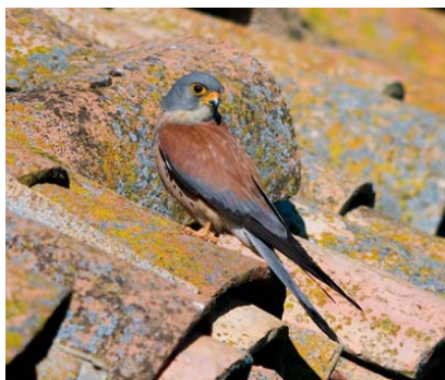
Figura 1. Macho de cernícalo primilla.

El cernícalo primilla presenta un marcado dimorfismo sexual con respecto a la coloración del plumaje (Cramp y Simmons, 1980; Tella et al. , 1996a). Los machos adultos presentan el obispillo, la cabeza y las grandes secundarias gris azuladas. La cola también es de color gris azulado y presenta una barra subterminal negra. Las escapulares y el manto son de un color herrumbroso y, a diferencia del cernícalo vulgar, carecen de moteado. Las partes inferiores son rojizas claro, con un moteado más o menos intenso que es bastante variable entre los individuos (Figura 1).