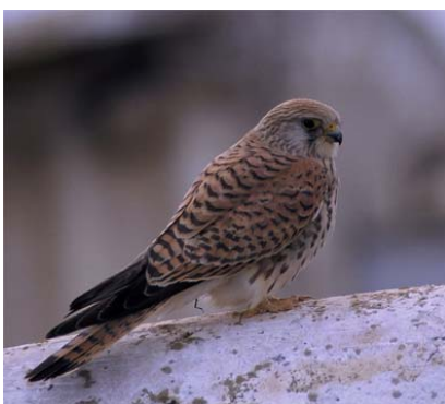
Figura 2. Hembra de cernícalo primilla.

Las hembras son bastante parecidas a las del cernícalo vulgar, presentando un color pardo con un marcado barreado. Por debajo son ocráceas con un estriado oscuro. La cola de las hembras es en general parda y las plumas caudales presentan unas ocho barras oscuras, siendo la banda subterminal mucho más ancha (Figura 2). Algunas hembras pueden presentar la cola (el 7,9 %; n = 239 ) y otras partes del cuerpo (el 35,0 %; n = 239 ) con el color gris azulado típico de los machos (Tella et al. , 1997a). En las hembras, este color gris azulado aumenta en general hasta los 3 años de edad (Tella et al. , 1997a). También se han descrito hembras con diferentes partes del plumaje con la coloración típica de los machos. En una de estas hembras, el patrón