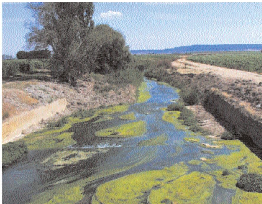
El río Riguel a su paso por la Comunidad.

La Comunidad de Regantes nº V (CR-V) se enmarca dentro de Sistema de Riego Bardenas (55.000 ha), puesto en marcha en 1958 con la construcción del embalse de Yesa (470 Hm 3 ). Posee unas 15.000 ha en riego por inundación y 500 ha en riego presurizado que se abastecen con agua del canal de Bardenas de excelente calidad ( CE= 0,33 dS/m, [NO_3^-] < 2 mg/L) para el riego, principalmente, de maíz, alfalfa, cebada, trigo, girasol y hortalizas.