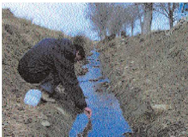
Muestreo de las aguas de drenaje de la Comunidad.

del riego y de la fertilización nitrogenada, especialmente en los suelos de saso regados por inundación. En consecuencia, se produjeron (1) consumos excesivos de agua de buena calidad regulada en el embalse de Yesa, (2) estreses hídricos moderados que disminuyeron el rendimiento potencial de los cultivos, (3) importantes mermas económicas derivadas de las elevadas pérdidas de nitrógeno en las aguas de drenaje y (4) afecciones ambientales negativas derivadas de los elevados flujos de retorno del riego con importantes contenidos en nitrato.