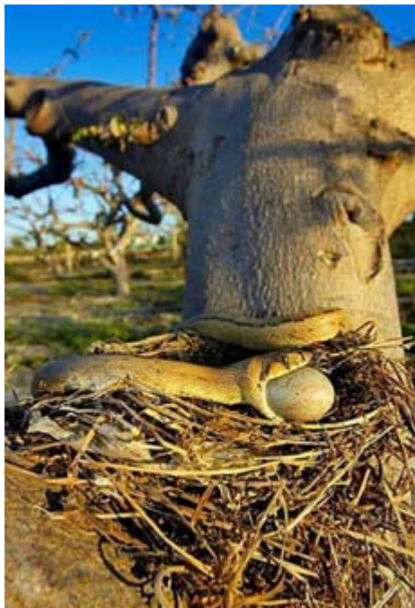
Figura 1. Culebra de escalera devorando huevo de mirlo.

La culebra de escalera es un forrajeador activo que recorre sistemáticamente el terreno en busca de sus presas (Curt y Galán, 1982; González de la Vega, 1988; Blázquez, 1993; Pleguezuelos, 1997). Esta afirmación también se puede deducir a partir de la observación de sus largos desplazamientos diarios con relación a otros colúbridos ibéricos (Blázquez, 1993; ver apartado de Actividad), o de la elevada frecuencia con la que aparecen presas inmóviles en su dieta (ver más arriba; Pleguezuelos et al., 2007). Inspecciona las galerías de micromamíferos en busca de presas (Pleguezuelos et al., 2007). También es una buena trepadora (Valverde, 1967), que sube por taludes y árboles en busca de nidos de Coracias garrulus (López-Jurado y Dos Santos, 1979), Merops apiaster (Vargas et al., 1983), Upupa epops , Oenanthe hispanica (Stehle, 1988), Riparia riparia , Hirundo rustica , Monticola solitarius (Pérez-Chiscano et al., 1978), Delichon urbica , Troglodytes troglodytes , Passer domesticus (Pleguezuelos, 1998), Rodopechys githaginea (J. Manrique, com. per.), Petronia petronia (Valverde, 1967), y murciélagos (Hellmich, 1956). Además de las presas que aparecen en la tabla 1 y de las citadas en este párrafo, se cita depredación sobre Alectoris rufa (Calderón, 1977).