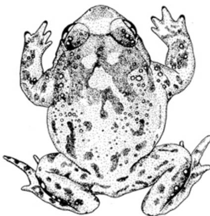
Figura 1. Aspecto dorsal de Alytes cisternasii . MNCN 20878.

La descripción original de Boscá (1879) es generalmente válida hoy, como lo reflejan las descripciones más recientes de Crespo (1981c, 1982c), Barbadillo et al. (1999), Salvador y García París (2001), García-París et al. (2004) y Malkmus (2012 3 ). Cabeza ancha y corta (como un tercio más ancha que larga en relación al cuerpo). Hocico redondeado. Ojos grandes y prominentes en disposición lateral. Pupila vertical e iris dorado vermiculado en negro sobre todo en su mitad inferior. Tímpano y pliegue gular bien visibles. Glándulas parotídeas reducidas y casi imperceptibles. Dientes vomerinos dispuestos en dos grupos de 9 a 12 dientes. Lengua circular y entera. Cuerpo corto y muy rechoncho (Figura 1). Miembros muy cortos y fuertes. Miembros anteriores robustos y muy cortos (semi envueltos en la piel del tronco) con cuatro dedos sin membrana interdigital. Con dos tubérculos metacarpianos. Miembros inferiores cortos, con un tubérculo metatarsiano cónico-truncado hacia delante, y con dedos sin tubérculos subarticulares y con membrana interdigital muy reducida. Piel de aspecto general laxo, de textura lisa y fina sobre la cara y porción superior de los dedos en las cuatro extremidades. En el dorso y ventralmente la piel es ligeramente granulada, faltando los folículos sobre la cara interna de los brazos y piernas y la externa de los muslos, y la parte inferior de la zona ventral del abdomen (aquí la piel es lisa y casi transparente).