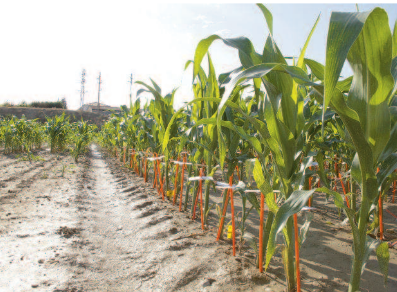
Identificación y descripción de plantas en campo