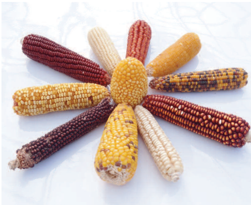
Ejemplo de variabilidad genética del maíz

A nivel mundial el maíz es el primer cereal en producción de grano con 819 millones de toneladas y una superficie sembrada de 160 millones de hectáreas, aunque en superficie es el tercero más cultivado después del trigo y arroz (FAO, 2012). Actualmente el maíz constituye la base de numerosos alimentos tanto para humanos como para animales domésticos, y de otros productos industriales, como el etanol o los bioplásticos. La mejora genética y el adecuado manejo del cultivo como los más eficientes sistemas de riego, aportes nutricionales, la oportuna elección de la densidad de siembra y la mejora de la maquinaria y los agroquímicos han proporcionado excelentes rendimientos a los actuales híbridos de maíz, haciendo que su cultivo sea mayoritario.