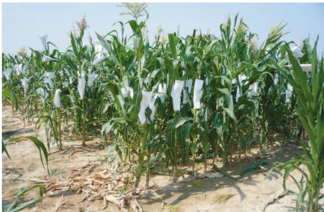
Ensayo de selección de plantas polinizadas. Montañana -2009-

246.1 kg/(ha y ciclo), mientras que en las poblaciones EZS33 y EZS34 las diferencias no fueron significativas. En relación a otros caracteres agronómicos de interés, se han mostrado valores muy positivos y con un elevado margen de mejora si se continúa con estos objetivos en el programa de selección.