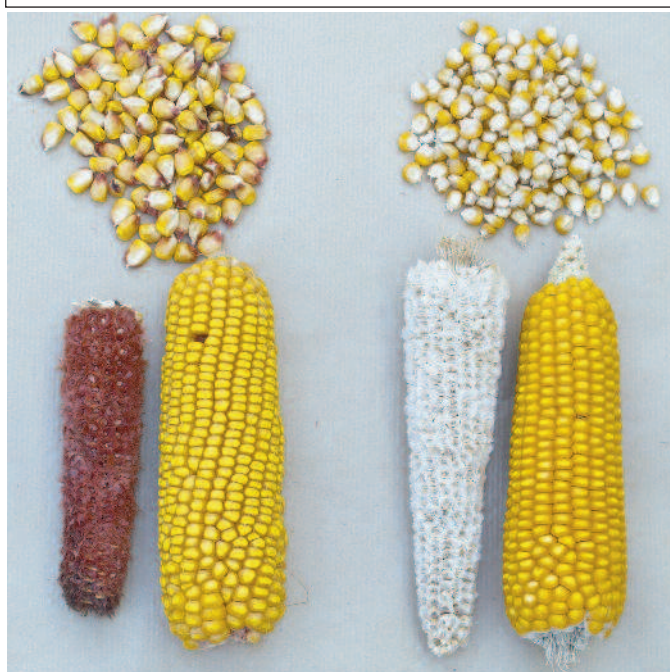
FIGURA 2 / Las dos poblaciones sintéticas: la población dentada EZS34 (izquierda) y la población lisa EZS33 (derecha)

Se han evaluado los tres ciclos de selección recurrente recíproca interpoblacional de ambas poblaciones en 5 ambientes (2 años y 3 localidades). Los años fueron 2009 y 2010, y las localidades de los ensayos: Montañana y Zuera (Zaragoza) y Torres de Alcanadre (Huesca). Los genotipos evaluados fueron las 8 poblaciones per se (EZS33C0, C1, C2, C3 y EZS34C0, C1, C2, C3), los 28 cruzamientos interpopulacionales entre los ciclos de selección, y 4 híbridos comerciales como testigos de referencia en los ensayos. Se estudió la respuesta de los cruzamientos y de las poblaciones per se para el carácter rendimiento y las respuestas correlacionadas en otros caracteres agronómicos de interés (Peña Asín, 2012). La ganancia de rendimiento de grano en el cruce interpoblacional (EZS34x EZS33) se incrementó de manera lineal y significativa a lo largo de la mejora en un 2.98% por ciclo, es decir