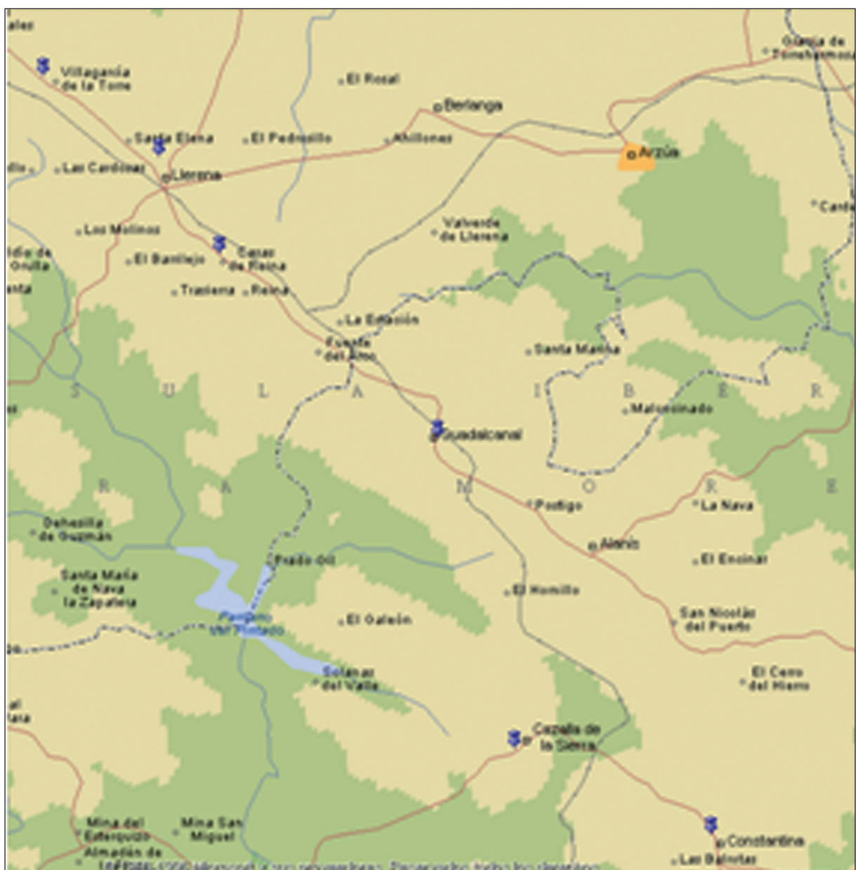
Figura 1. Itinerario de antonio garcía, vecino de fuente de cantos, casado y herrero

Pasaporte para El Pedroso, con su mujer y dos caballerías mayores y una menor, emitido en Cazalla el 1-2-1844