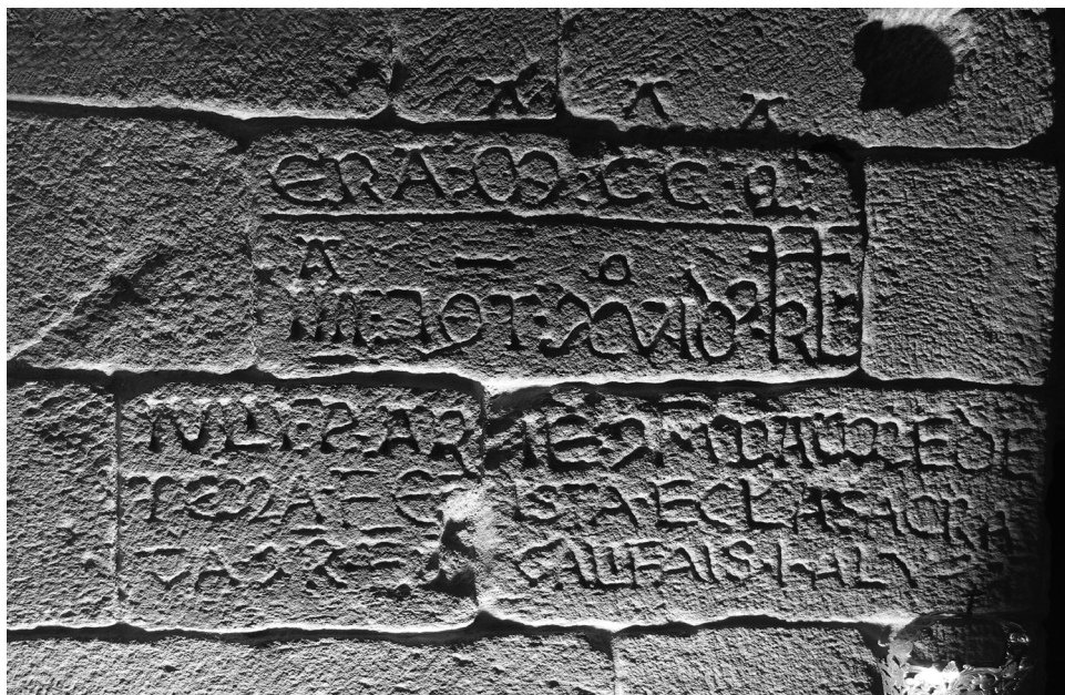
Inscripción de Santa María de Castrelos (Vigo, Pontevedra). Año 1216