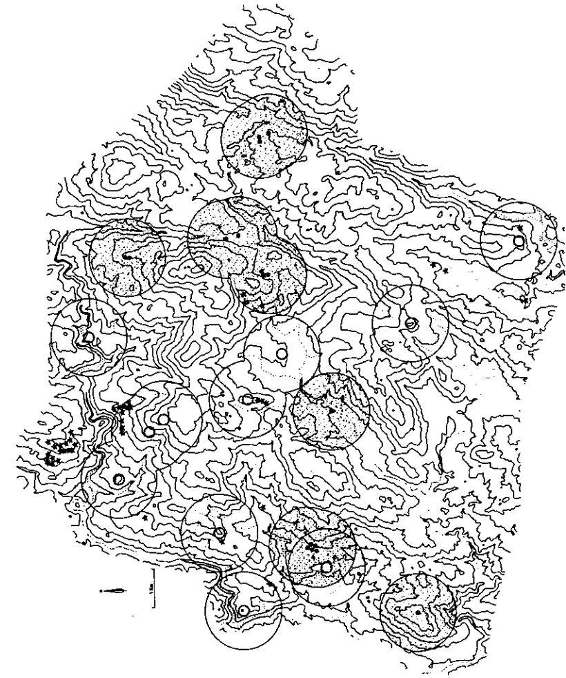
FIGURA 3. Áreas de círculo fixo de 1 qm. En torno ós castros e ás mámoas.