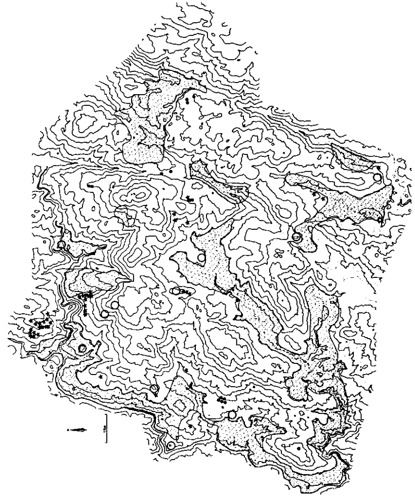
FIGURA 4. Indicaeas cun sombreado as áreas de cultivos e de uso intensivo do solo.