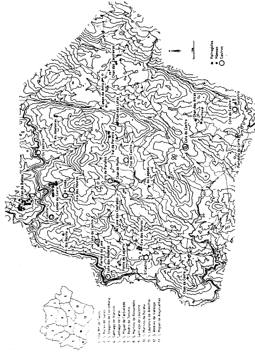
FIGURA 2. Localización das mámoas, petroglifos e castros. Na parte superior esquerda representanse as divisións parroquiais (Torres e Pazo, 1994).