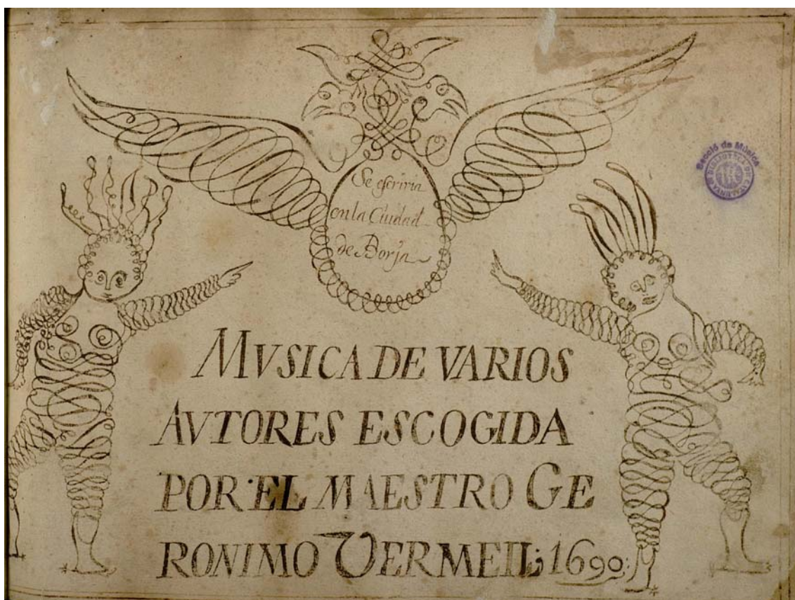
« Música de varios autores escogida por el maestro Gerónimo Vermell ». (1690) Barcelona. Biblioteca de Catalunya, M. 927, Portada