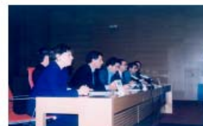
Discurso de bienvenida de D. MIGUEL A. FERNÁNDEZ LORES (Excmo. Sr. Alcalde de Pontevedra)