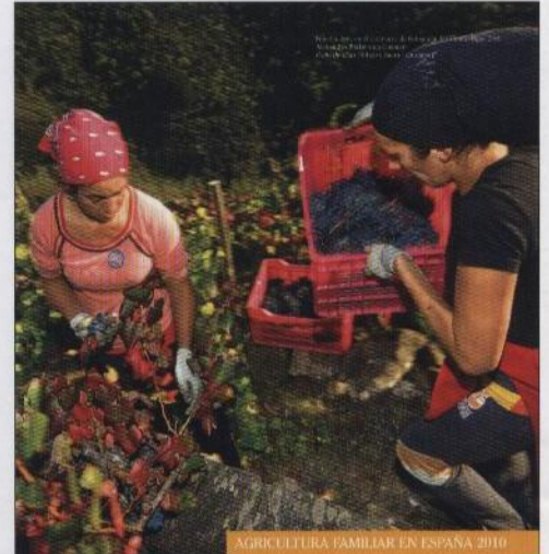
AGRICULTURA FAMILIAR EN ESPAÑA 2010