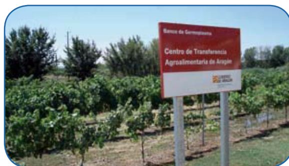
El Banco de Germoplasma del Gobierno de Aragón fue creado en 1989

- Informe final del proyecto: Proyecto de la Acción estratégica de Conservación de Recursos Genéticos de interés