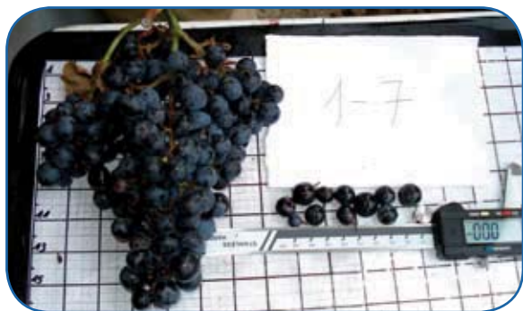
El Banco de Germoplasma cuenta en la actualidad con 540 entradas de material vegetal.

obtenidos con las mismas variedades ubicadas en Movera, para determinar la correcta duplicación de material en las nuevas viñas.