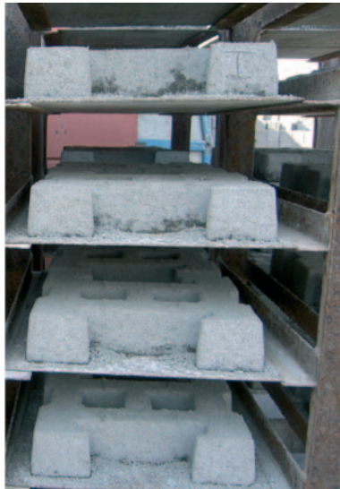
Fig. 4: Bloques de hormigón realizados con ceniza volante activada alcalinamente (contenido de OPC < 20%)

(cenizas procedentes de las centrales térmicas). El proceso de activación alcalina de materiales silicoaluminosos (con composiciones del tipo de la de las cenizas volantes) se puede describir en términos de un modelo polimérico similar a los esquemas propuestos para describir las reacciones de formación de determinadas zeolitas, en donde el Al y Si inicialmente en disolución, reaccionan entre sí para formar poli-hidroxi-silicoaluminatos complejos.