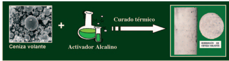
Fig. 2: Representación esquemática del proceso de activación alcalina de cenizas volantes

La comunidad internacional comenzó hace tiempo a estudiar la forma de abordar estos problemas a nivel global. En las cumbres internacionales sobre medioambiente celebradas en Río de Janeiro (1992) y Kioto (1997)