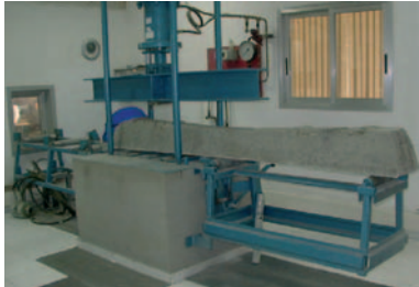
Fig. 3: Hormigón y traviesas de ferrocarril realizados con ceniza volante activada alcalinamente (sin cemento Portland)