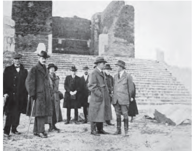
Fig. 15. (A la derecha) Miembros de la American School en una excursión a Ostia. Art and Archaeology , vol. XIX, 2, 1925.

nes de Arthur Evans en Knossos; la arqueología desplegada por L'École française d'Athènes (1873) a partir del último decenio del siglo XIX en Delfos, Delos o Thasos, 89 en competencia con los alemanes del Athener Institut (1874), implantados en sus yacimientos de Olimpia, Samotracia, Tebas, Samos, el Cerámico de Atenas, etc. 90 El DAI sin embargo no se resentía de esta laguna, al no comprenderse entre sus funciones la actividad arqueológica práctica, sino la profundización en los resultados aportados por dicha ciencia, las investigaciones históricas y su divulgación. Al verse desprovistas de las prominentemente arqueológicas había condicionado la orientación de algunas escuelas romanas hacia otra clase de tareas: estudios topográficos —si bien de una alta calidad, que han dejado una importante documentación fotográfica y cartográfica de monumentos y yacimientos 91 —, investigación en museos y bibliotecas, ensayos de historia clásica, y hacia una acrecentamiento de los campos del saber más allá de la Antigüedad, a las historias medieval y del cristianismo primitivo, o al arte italiano. Institutos como el americano, organizados con una doble funcionalidad científica y educativa, completaban sus cursos de paleografía latina y griega, de numismática, de historia de Roma, de su topografía antigua y de la del Lacio, 92 con viajes anuales a Grecia, programados en los meses de primavera, precedidos de la