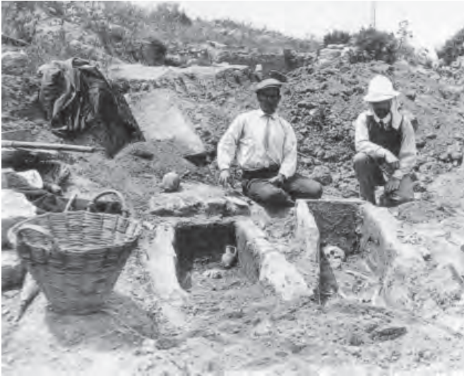
Fig. 16. Excavaciones en la puerta norte de la necrópolis de Motya, c 1911 (Wallace-Hadrill, 2001).

económicamente—, sino también en legislar la protección de su patrimonio. 98 Más allá de una simple excavación, Ashby aspiraba a crear un plan de investigación relativo a la prehistoria del conjunto del Mediterráneo occidental, por lo que se interesó en documentar los trabajos del magnate Joseph Whittaker en el asentamiento púnico de Motya (Sicilia) y bajo su coordinación Duncan Mackenzie y el arquitecto F. G. Newton ejecutaron asimismo dos campañas en Cerdeña (1908 y 1909), cuya cultura megalítica («civilización dolménica»), caracterizada por las ‘nuragas’ y las llamadas ‘tumbas de gigantes’, Mackenzie englobó en el contexto general del Mediterráneo, oeste de Europa, Gran Bretaña y Noruega, a la par que ensayaba una descripción de las fases