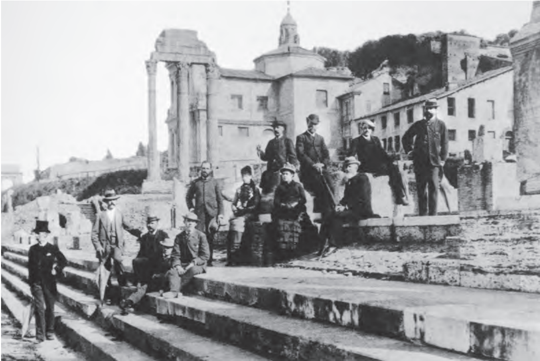
Fig. 12. Arqueólogos italianos y extranjeros en las escalinatas de la Basílica Julia, 1880.