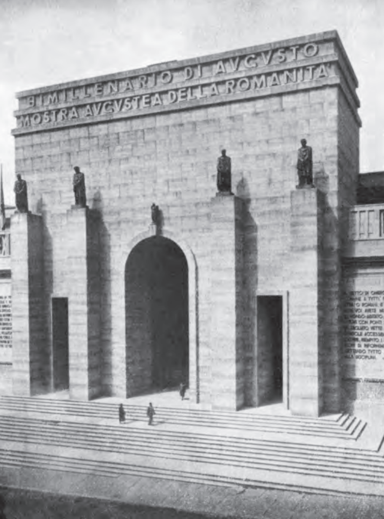
Fig. 13. Fachada del Palazzo delle Esposizioni durante la Mostra Augustea della Romanità, 1937-1938.