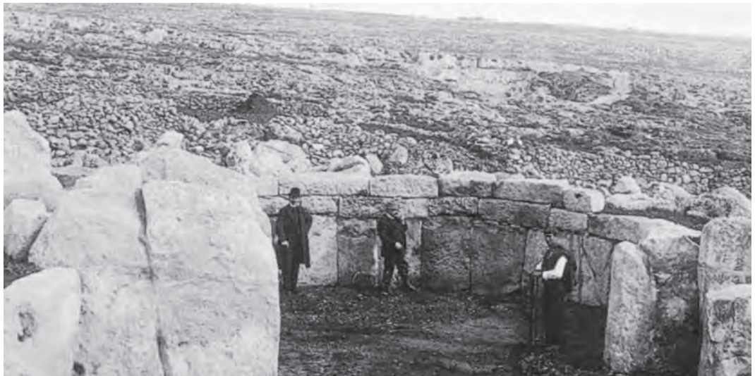
Fig. 17. Excavaciones prehistóricas en Mnajdra (Malta), c. 1911 (Wallace-Hadrill, 2001).

evolutivas de los monumentos en dolmen 99 (figs. 16 y 17). Las excavaciones de Malta se prolongaron entre 1908 y 1911, fruto de las cuales nacieron los estudios cerámicos del estudiante de arqueología T. E. Peet, quien examinó el sitio de Bahria, el cual conjeturó corresponder a una colonia de una «raza»