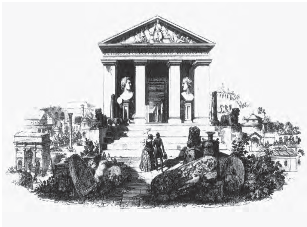
Fig. 11. Primera sede del Instituto Arqueológico Germánico en el Campidoglio, 1835-1876.

con la Academia Española de Arqueología 10 ), sumado a una clara voluntad de aperturismo. 11