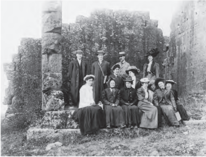
Fig. 14. (A la izquierda) Estudiantes de la Escuela Americana de Estudios Clásicos en Gabii, c. 1902 (Huemer, 2008).