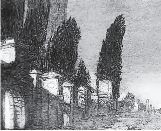
Fig. 18. Teodoro Anasagasti, Vía de los Sepulcros , c. 1915. Madrid, colección privada.

apadrinada por la JAE. 116 Independientemente a esto, en las décadas iniciales del siglo pasado, y ante una EEHAR consagrada a los análisis documentales y poco después abandonada a la deriva, los arquitectos de la Academia Española de Bellas Artes representaron nuestra arqueología en Italia y fuera de ella, al ejecutar importantes proyectos no sólo en la capital sino en toda el área mediterránea, siguiendo una tradición de cuño ilustrado, todavía con reminiscencias de un saber anticuario, pero con una diáfana vocación de cientificismo y modernidad: hablamos de profundos reconocimientos como los de Fernando García Mercadal en el sur de Italia y Sicilia en su búsqueda de los restos de la civilización