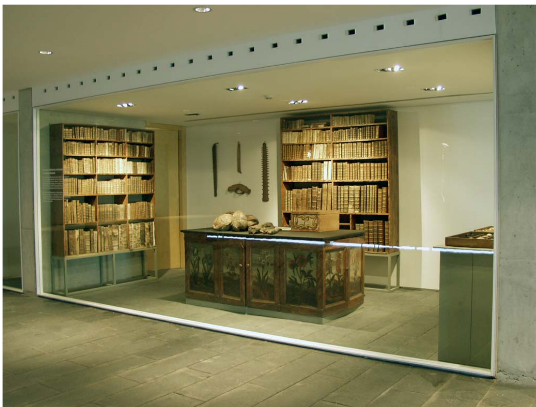
Parte del fondo bibliográfico del Museo Salvador

Al ser la familia Salvador pionera en los estudios de Botánica en la Península, entre las obras bibliográficas que conservaron destacan muchas de autores prelinneanos, muy raras en el conjunto de las bibliotecas científicas españolas. Catálogos de jardines botánicos italianos, franceses, alemanes junto a las obras de autores fundamentales para el conocimiento de la Botánica le proporcionan un importantísimo valor al conjunto de la colección.