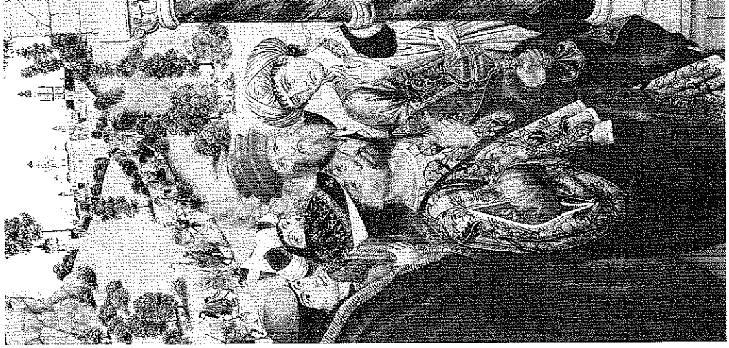
Fig. 2. DIEGO DE LA CRUZ.