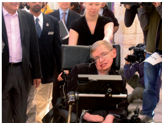
Figura 2. Stephen Hawking de camino a una conferencia ante estudiantes de secundaria en Jerusalén, el 10 de diciembre de 2006.

Recuerdo todavía que la primera noche dormí como un ángel. Me despertaron los golpes en la puerta, cada vez más fuertes e insistentes, de una azafata que me preguntaba si deseaba desayunar en la cama. “Tenemos filete, huevos, bacon, salchichas, alubias, queso, tomates, mermeladas a elegir...”, me soltó a toda velocidad, sin siquiera detenerse a respirar. “No, gracias, no tengo tiempo de tomar el desayuno en la cama...”, le respondí, mientras empezaba a vestirme a toda prisa; y añadí: “Por favor, ¿por dónde se va al comedor?” “Veamos. Si esta puerta del fondo del corredor estuviera abierta, podría ir directamente por allí, señor. Pero suele estar cerrada y lo más probable es que tenga usted que salir al patio, luego torcer a la derecha y...”. El comedor era una sala majestuosa, más bien parecía una nave de una catedral gótica, con paredes parcialmente recubiertas de