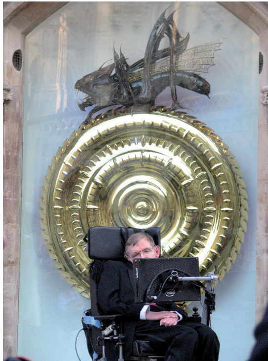
Figura 4. Stephen Hawking presenta al público el Corpus Clock, en la Biblioteca Taylor, Corpus Christi College, Cambridge. Fecha: 19 de septiembre de 2008. (CC BY-SA 2.0).

Del dicho al hecho, sin embargo, a veces hay un abismo. Y éste es el que Hawking fue capaz de superar , en este caso, y de una manera muy brillante, dando una demostración técnicamente impecable, bellísima y cuantitativa de aquella predicción.