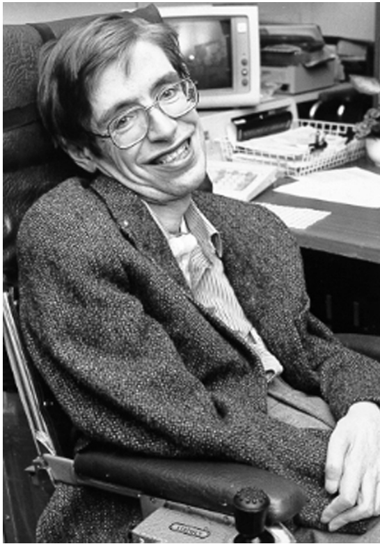
Figura 1. Imagen de Stephen Hawking, elegido miembro de la Royal Society en 1974.

aquello. Como ya he dicho, el interés crecía cada día que pasaba, en los corrillos que se formaban a todas horas. Yo quedé muy sorprendido por aquella situación, que he recordado siempre —vuelvo a repetir que se trataba de mi primera conferencia internacional, fuera de casa.