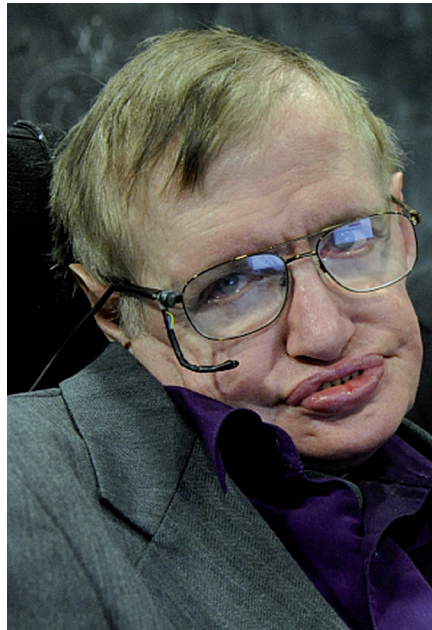
Figura 5. Stephen Hawking el 28 de agosto de 2013. (CC A-SA 2.0 G).