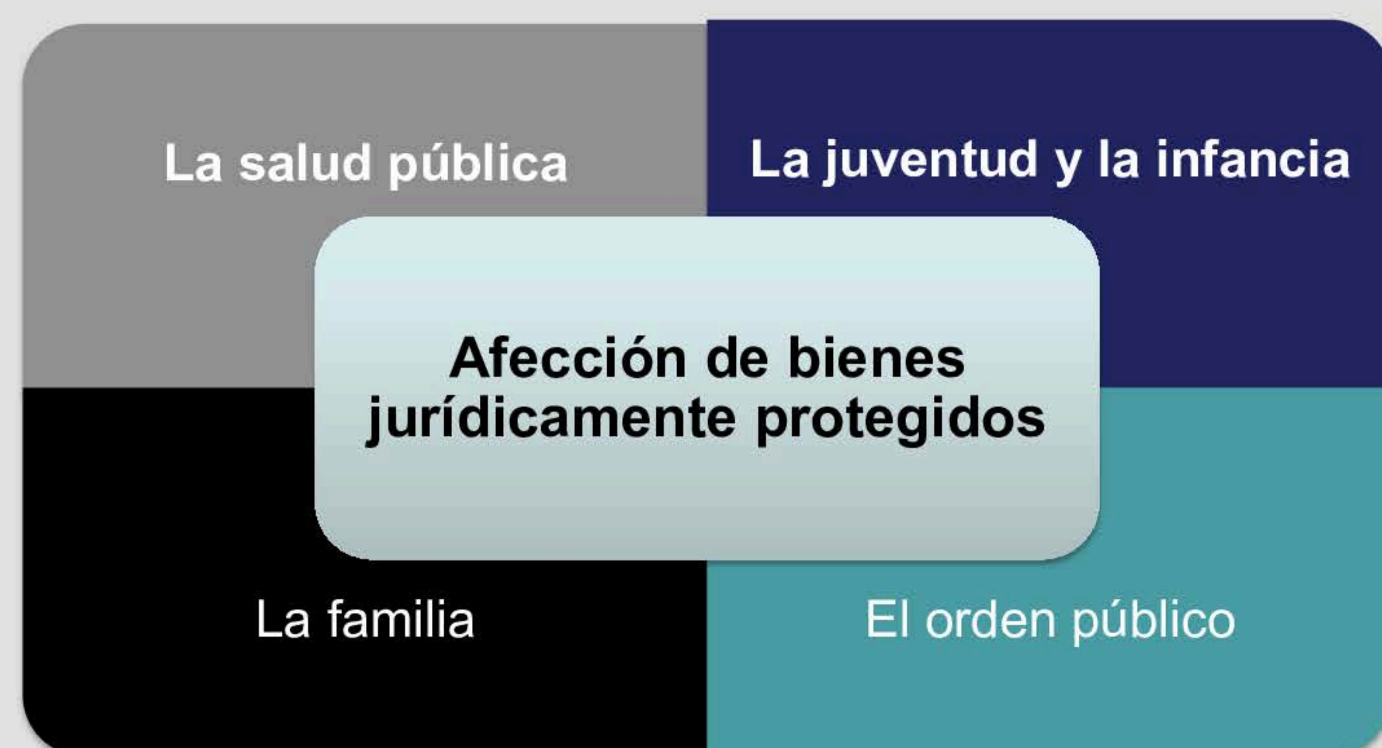
Figura 3. Bienes jurídicamente protegidos que se ven afectados por el juego