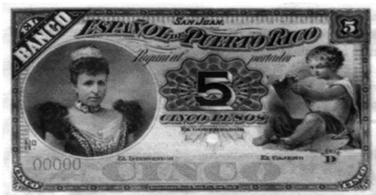
Anverso del billete de 5 pesos del Banco Español de Puerto Rico, emitido en 1894. [ http://gkworldcoins.webs.com/historianumismaticadepr.htm Consultado: 21 de mayo de 2013].

fue similar, si bien la cifra de negocios es menor. En conjunto, el activo (en moneda corriente y nacional) se dobló hasta alcanzar los 5,3 millones pesos en 1894.