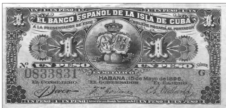
Billete con valor de un peso, emitido en 1896, http://www.monedalia.es/1896-1-peso-banco-espaol-de-la-isla-de-cuba_681.htm (Consultado: 21 de mayo de 2013).

Se formularon entonces planes para enderezar la entidad: sanear el activo, devolverle los créditos, reponer el capital perdido y llevar a cabo una completa reorganización de la entidad. A cambio, el Banco se comprometía a aumentar su capital en dos millones de pesos, a mantener el encaje exigido por los estatutos y a prestar al Tesoro un mínimo de 12 millones de pesos oro. Los planes no fructificaron. El Banco no llevó a cabo la ampliación prometida porque las acciones corrían con un descuento del 50 por ciento y las emisiones que realizó en 1896 y 1897 fueron rechazadas por la población y tuvieron que retirarse.