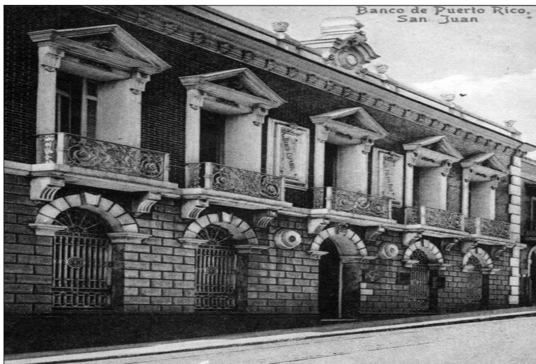
Imagen del Banco Español de Puerto Rico, http://www.fideicomiso.org/wp-content/uploads/2012/07/Banco-Espanol-de-PR-1.jpg (Consultado: 17 de mayo de 2013).

Pensaban que de esta manera el establecimiento atendería a una doble y sentida necesidad: surtir de crédito a la economía y proporcionar medios de pago a aquel mercado, resolviendo un problema de escasez monetaria que aquejaba a la colonia desde que cesó el situado. 17 La petición no prosperó a pesar del apoyo de las autoridades locales 18 , pero los hombres de negocios de la colonia