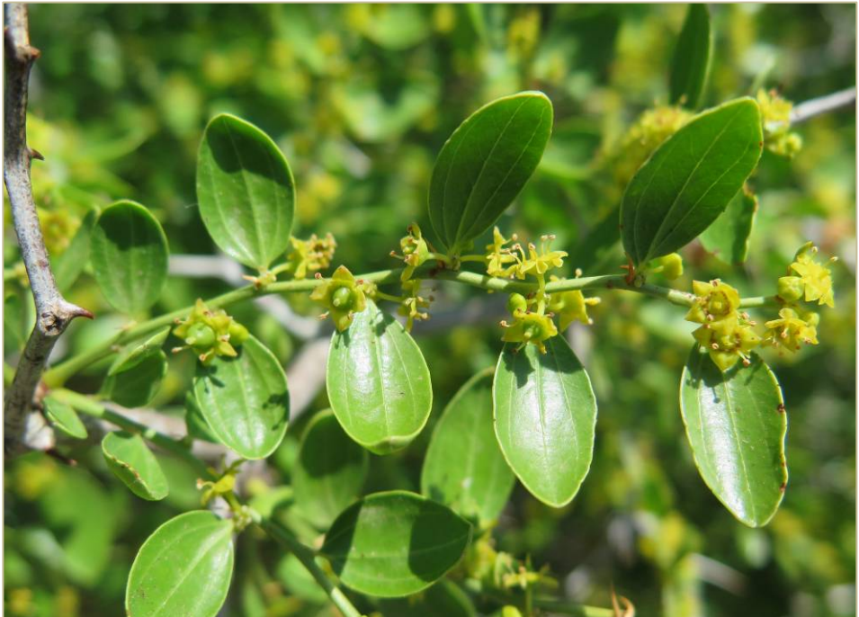
Fig. 1. Ejemplar de Ziziphus lotus en Museros (Valencia) y detalle de un braquiblasto con flores.