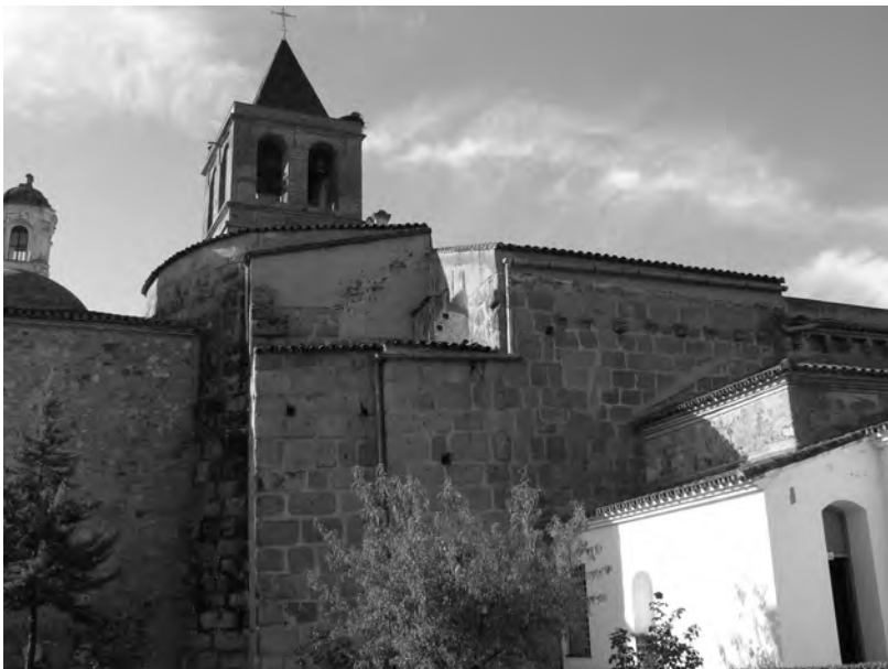
Fig.3.- Conservación de la cabecera de la basílica visigoda de Santa Eulalia.

Aunque este lamento aún no se ha refrendado con pruebas arqueológicas sobre la amortización de los templos cristianos, el clérigo se refiere en pasado a los oficios religiosos en las iglesias, ya sin servicio, mientras que, por el contrario, la comunidad de fieles musulmanes no deja de crecer. La basílica de Santa Eulalia, que parcialmente se conserva en alzado, estuvo en uso hasta, al menos, el s. IX (fig. 3), cronología igualmente propuesta para Casa Herrera (fig. 4). Desconocemos el