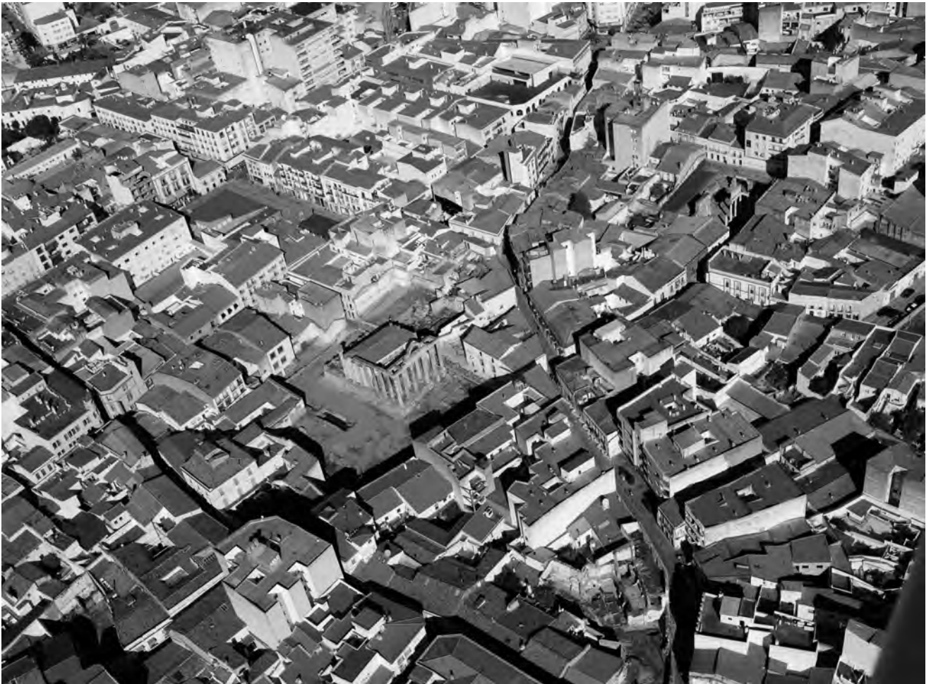
Fig.4.- Iglesia paleocristiana de Casa Herrera, en servicio hasta el s. IX.

emplazamiento de la primera mezquita, pero pudo compartir espacio con alguna iglesia visigoda (de emplazamiento en la actual plaza, en la concatedral de Sta. María), hasta quedar el lugar para uso exclusivo de los fieles musulmanes, como así ocurrió en Córdoba. Edificios como el templo de Diana y el arco de Trajano persisten reutilizados, posiblemente vinculados a un simbolismo del nuevo poder (fig. 5). Contamos, sin embargo, con evidencias de un importante número de