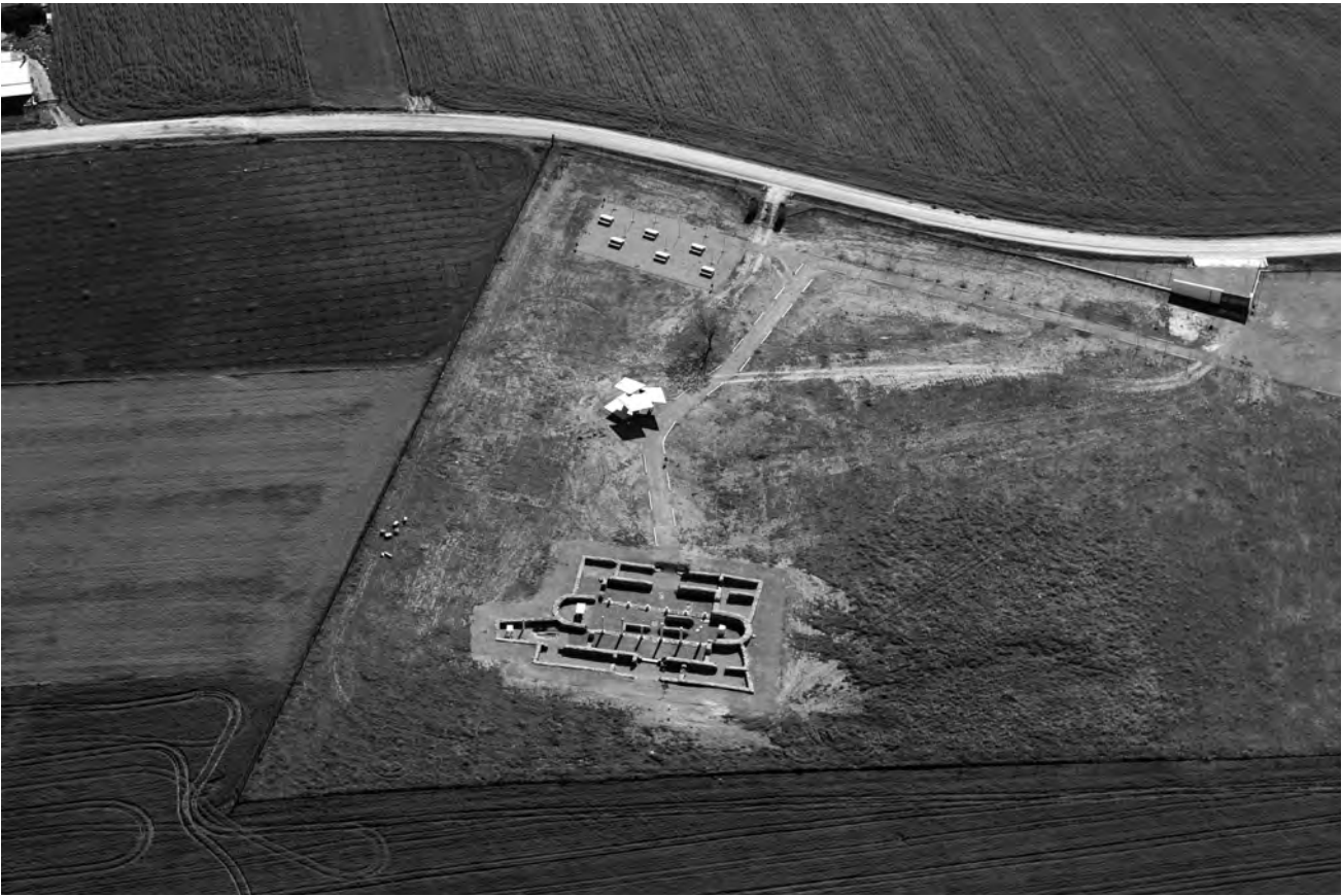
Fig. 5-Reutilización tardoantigua y altomedieval del Templo de Diana como inmueble residencial señorial.