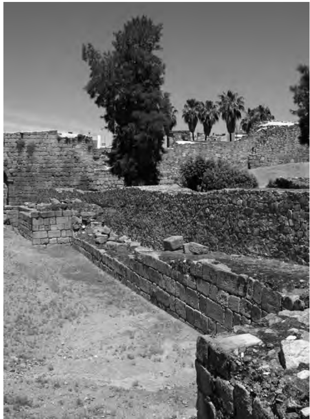
Fig.1.- Muralla romano-visigoda que hizo frente al asedio del 712-713.

Las crónicas apuntan que las tropas de Muza venían espoleadas por los fáciles éxitos de conquista de ciudades como Carmona, Medina Sidonia y Sevilla, enclaves de mayor importancia que los ocupados por las fuerzas de Tariq. Por ello, se plantean tomar Mérida como siguiente objetivo, dadas las expectativas de botín en la más importante de las ciudades de Lusitania “donde residían algunos grandes señores de España, y que también tenía monumentos, un puente, palacios e iglesias que exceden toda ponderación” según se describe en el compendio de relatos del Ajbar Machmua . Pero aquí encontrarán una tenaz resistencia de la población a resguardo de las gruesas, sólidas y altas murallas levantadas con sillares en el siglo V y provistas de torres (fig.1), que forran la muralla fundacional. Unas