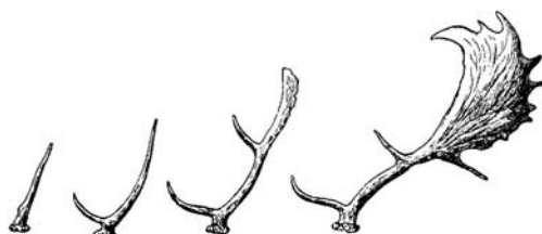
Figura 1. De izquierda a derecha, cuernas de gamo de uno, dos, tres y siete años. Según Cabrera (1914).

Como en la mayoría de los cérvidos, el aspecto externo de machos y hembras es muy distinto, con dimorfismo sexual muy acentuado, sobre todo cuando alcanzan la edad adulta, ya que sólo los machos tienen cuernas. Éstas, echadas hacia atrás e implantadas sobre pedúnculos muy cortos, presentan tres candiles y una ancha palma que se rasga en varias puntas, característica de esta especie. Las cuernas planas del gamo son únicas en su aspecto entre los cérvidos actuales; solamente el alce ( Alces alces ) y, en parte, el reno ( Rangifer tarandus ) poseen también cuernas aplanadas, aunque de aspecto muy diferente.