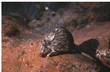
Figura 1. Desmán ibérico.

Nos basaremos en la descripción realizada por Cabrera (1914) para la especie, dado que se trata de un género monoespecífico sin ninguna similitud estrecha con ninguna otra especie de la fauna ibérica.