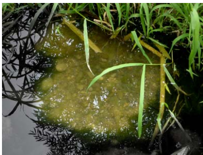
Figura1. Nido de pez sol (zona libre de vegetación y sedimentos).

El pez sol presenta reproducción múltiple (con pocos eventos reproductivos dentro un mismo año) y cuidado paternal llevada a cabo por machos territoriales (Garvey et al., 2002). Aunque en Canadá la especie está considerada dentro de la categoría de “equilibrio” según la clasificación de Winemiller y Rose (1992), en su área de distribución no nativa presenta una estrategia más oportunista, con períodos reproductivos más prolongados y edad y tallas de maduración sexual avanzadas (Fox et al., 2007).