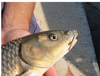
Figura 3. Detalle de los tubérculos nupciales de un macho adulto de Barbus sclateri de la cuenca del río Segura.