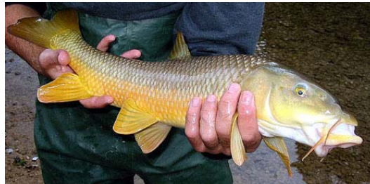
Figura 2. Detalle de la boca protráctil de un ejemplar adulto de Barbus sclateri de la cuenca del río Segura.

Su cuerpo es fusiforme, alargado y robusto, y el pedúnculo caudal es más alto que en otras especies del mismo género. La boca, relativamente pequeña, es protráctil y está situada en posición ínfera (Figura 1). Los labios son gruesos, aunque a veces el inferior se encuentra retraído, dejando ver el dentario (Gunther, 1868; Lozano Rey, 1935) (Figura 2). Presenta dientes faríngeos dispuestos en tres filas (Vélez de Medrano Sanz, 1947).