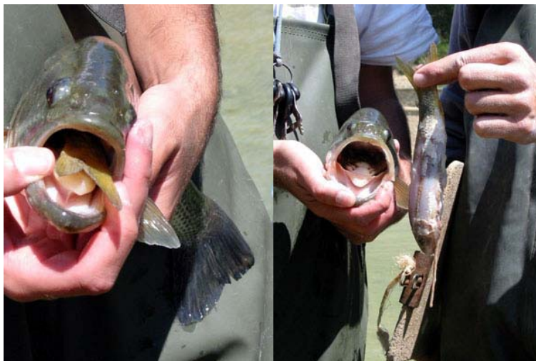
Figura 1. Detalle de la cavidad bucal de un ejemplar de Micropterus salmoides donde se puede observar la aleta caudal de un ejemplar de Barbus sclateri (foto izquierda) a punto de ser digerido (foto derecha) en la cuenca del Segura.

Prenda y Granado-Lorencio (1992) han realizado análisis biométricos para estimar el tamaño y peso a partir de fragmentos de huesos hallados en excrementos de nutria.