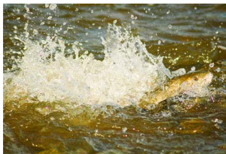
Figura 2. Comportamiento de freza del barbo cabecicorto, mostrando el intenso batimiento caudal durante la misma.