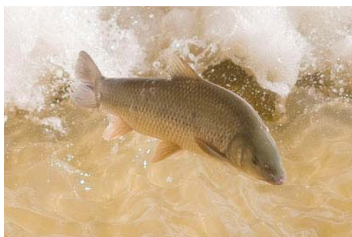
Figura 2. Barbo cabecicorto saltando para rebasar un obstáculo durante la migración pre-reproductiva.