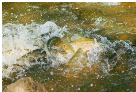
Figura 1. Comportamiento de freza del barbo cabecicorto, mostrando varios ejemplares macho que siguen a una hembra.

Sigue siendo en gran parte desconocida y suponiéndose similar a otras especies de barbos, de las que hasta donde se sabe no parece diferenciarse mucho. El barbo cabecicorto realiza migraciones prereproductivas hasta alcanzar los hábitats adecuados para la freza, en profundidad, sustrato y corriente. En años hidrológicamente normales, la reproducción sucede a la migración entre abril y junio (Almaça, 2003; R. Morán, datos propios). Los machos desarrollan tubérculos nupciales en este periodo, que en algunos ejemplares perduran más tiempo. La freza tiene lugar en aguas someras y corrientes con sustrato grueso, donde dos o más ejemplares – macho/s que sigue/n a una hembra, generalmente ésta de mayor talla (Figura 1) – baten súbita e intensamente sus pedúnculos caudales mientras liberan los productos sexuales (Figura 2). Tras los periodos de freza los ejemplares retornan a aguas más profundas, pudiendo sucederse ulteriores eventos de migración y freza (R. Morán, datos propios).