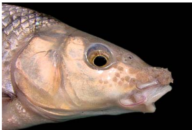
Figura 2. Tubérculos nupciales de un macho de barbo cabecicorto en época reproductora.

La hembra tiene la aleta anal más larga que los machos, carácter que estaría relacionado con la remoción del lecho durante la puesta. Los machos durante la época reproductora presentan tubérculos nupciales en la parte anterior de la cabeza, pudiendo alcanzar el entorno de los ojos (Figura 2). El último radio duro dorsal parece ser mayor en los machos (Almaça, 2003). Las hembras alcanzan tallas y pesos medios y máximos superiores a los machos (R. Morán, datos propios).