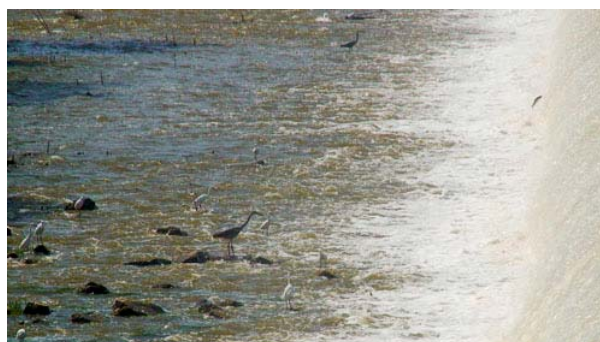
Figura 1. Garzas reales y garcetas depredando sobre los peces que se acumulan bajo un azud del río Guadiana durante la época reproductora.

No se conocen estudios específicos de depredación en barbo cabecicorto. En tramos del río Guadiana donde conviven los barbos cabecicorto y comizo con intervalos de talla similares (R. Morán, datos propios) se ha observado la depredación de barbos por parte del cormorán ( Phalacrocorax carbo ) en pozas, y comportamientos de captura en rápidos durante la freza por cigüeña blanca ( Ciconia ciconia ) y garza real ( Ardea cinerea ). Garza real y garceta común ( Egretta garzetta ) realizan esperas en las acumulaciones de peces ante obstáculos en aguas bajas, mientras que el cormorán realiza capturas en los mismos lugares en periodos de aguas altas (Figura 1).