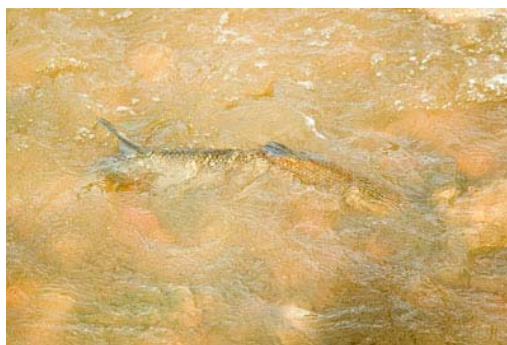
Figura 1. Barbo cabecicorto remontando un tramo somero del río Guadiana en periodo de migración.

El barbo cabecicorto realiza migraciones pre-reproductivas hasta alcanzar los hábitats adecuados para la freza. En estas migraciones los adultos pueden rebasar aguas muy someras (Figura 1) exponiéndose a la predación. También tienen el comportamiento de saltar para franquear obstáculos (Figura 2) aunque éstos pueden rebasar sus capacidades (Figura 3), aspecto que ha sido escasamente estudiado. En años hidrológicamente normales, la migración precede a periodos de reproducción en respuesta a las variaciones del caudal de abril a junio; no obstante la migración puede adelantarse a la segunda mitad de marzo en respuesta a caudales importantes (R. Morán, datos propios).