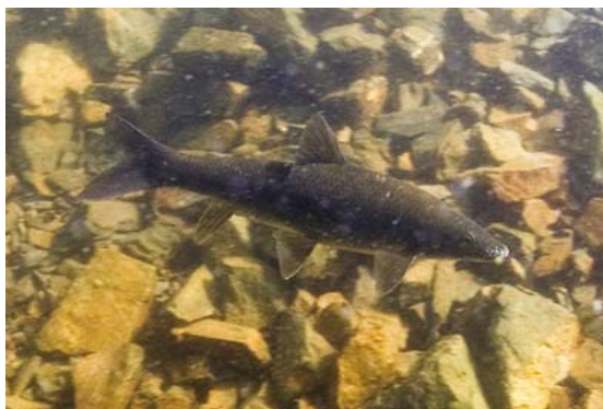
Figura 1. Barbo cabecicorto macho en el embalse de La Serena (río Zújar, cuenca del Guadiana) durante la época reproductora.

Filipe et al. (2004) encuentran grandes cambios en la distribución de las poblaciones entre la estación húmeda y seca, con una transición en marzo que en adelante hace mucho menos probable encontrar la especie en los tributarios menores. Además de en medios fluviales, el barbo cabecicorto ha sido citado en embalses (Figura 1; Godinho et al. , 1998; Doadrio, 2002).