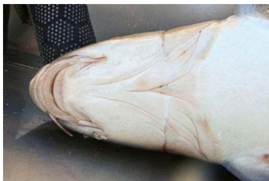
Figura 1. Vista inferior de la cabeza de un barbo cabecicorto, donde se muestra la exposición de maxilar y dentario y la corta longitud de las barbillas.

Barbo que alcanza tallas similares a la mayoría de barbos ibéricos, se diferencia principalmente por la cabeza proporcionalmente menor respecto al cuerpo (18,5-22,2% de la longitud total) y poseer una forma claramente convexa. Los ojos son cercanos pero no tangentes al perfil dorsal, a diferencia del barbo comizo ( Luciobarbus comizo ). Existe una pequeña depresión anterior a las narinas.