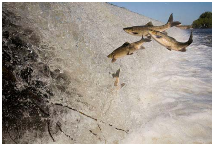
Figura 3. Fotomontaje de una secuencia de cuatro fotografías a alta velocidad de un ejemplar de barbo cabecicorto saltando ante el Azud de la Granadilla (río Guadiana en Badajoz) durante su migración.