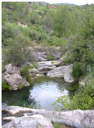
Figura 1. Tramo alto del arroyo Ayódar (Sierra Espadán, Castellón), hábitat característico de Barbus haasi con presencia de aguas limpias, frescas y bien oxigenadas.

En el río Vallvidrera utiliza las zonas más profundas con un máximo de cuevas para refugiarse (Aparicio, 2002). En el río Matarraña se encuentra preferentemente en microhábitats profundos con sustrato heterogéneo. La variación estacional en el uso de microhábitats se correlaciona fuertemente con los cambios estacionales en la disponibilidad de microhábitats. Los individuos grandes a veces se encuentran en microhábitats más profundos y con mayor velocidad que donde se encuentran los individuos más pequeños. Los individuos pequeños se encuentran más próximos a refugios (Grossman et al., 1987). En otro estudio del uso del hábitat realizado en el río Matarraña B. haasi mostró preferencia por las zonas más próximas al sustrato y con abundancia de refugios, así como aquellos microhábitats con un elevado recubrimiento de algas filamentosas y tiende a evitar sustratos de piedras (Grossman y De Sostoa, 1994).