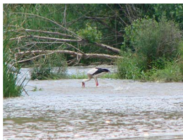
Figura 6. Cigüeña común alimentándose en un rápido del río Guadiana (Badajoz), atraída por los movimientos de freza de L. comizo (salpicaduras justo tras el ejemplar).

La nutria ( Lutra lutra ) depreda sobre los barbos ( L. comizo y L. bocagei ) (Morales et al., 2004).