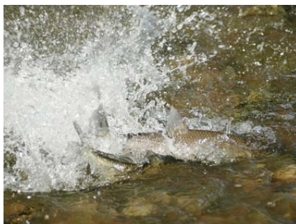
Figura 5. Barbos comizos frezando en un tramo somero y con corriente del río Guadiana.

La freza tiene lugar en aguas someras y rápidas, donde dos o más ejemplares baten fuertemente los pedúnculos caudales mientras se libera los productos sexuales (Figura 5).