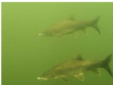
Figura 3. Machos de barbo comizo en el embalse de la Serena (Badajoz) en época reproductora.

También se encuentra en embalses (Figura 3) (Doadrio, 1986; Godinho et al., 1998).