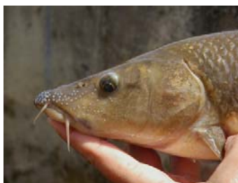
Figura 4. Tubérculos nupciales en la cabeza de un barbo comizo macho, a finales de abril.

Apenas hay datos. El período reproductor comprende la primavera e inicios del verano, entre los meses de abril a junio (Pérez-Bote et al., 2006). Periodos de migración y freza se pueden alternar en función de las variaciones del ambiente hidráulico (caudal, velocidad de corriente, profundidad, etc.), que determinan condiciones más aptas para uno u otro proceso. Durante el período reproductor el macho desarrolla unos tubérculos nupciales en la zona anterior de la cabeza (Figura 4).