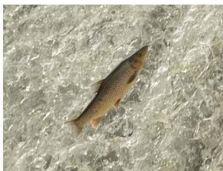
Figura 7. Barbo comizo en migración saltando para rebasar un obstáculo en el río Guadiana.

A lo largo de todo el periodo reproductor, entre abril y junio, los adultos realizan migraciones curso arriba hacia zonas más someras, de mayor corriente y sustrato de grava. L. comizo posee la capacidad de remontar tramos extremadamente someros sorteando la rugosidad del lecho, incluso hasta el punto de quedar el dorso expuesto al aire, y también de saltar para rebasar obstáculos mayores (Fig. 8) (R. Morán López, obs. pers.).